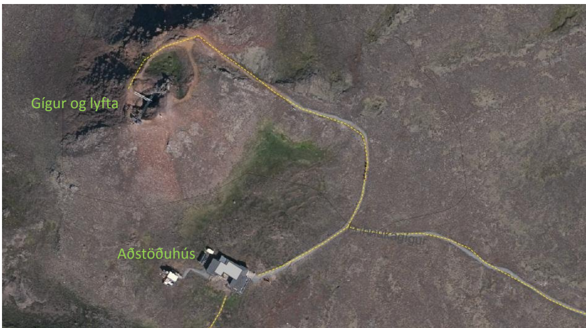
Mynd 2. Loftmynd af aðstöðu við Þríhnúkagíg, sjá má aðstöðuhús ásamt lyftu ofan í gíginn.

Boðið hefur verið upp á skoðunarferðir niður í Þríhnúkagíg um nokkurra ára skeið. Gestir Þríhnúkagígs hafa nýtt bílastæði við skíðasvæðið í Bláfjöllum og er gengið þaðan og upp að gígnum um 3 km leið. Í gígnum er opin lyfta sem notuð er til að síga með gesti niður á gígbotninn, um 120 m. Aðstöðuhús er nærri gígnum þar sem er aðstaða fyrir nauðsynlegan öryggisbúnað, veitingaaðstaða og salerni. Boðið hefur verið upp á ferðir niður í gíginn frá maí til október ár hvert. Rekstrarleyfi hefur verið veitt til eins árs í senn.