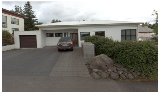
Mynd 1. Loftmynd af umræddri lóð, tekin af kortavef Kópavogs og ásýnd frá götu af ja.is