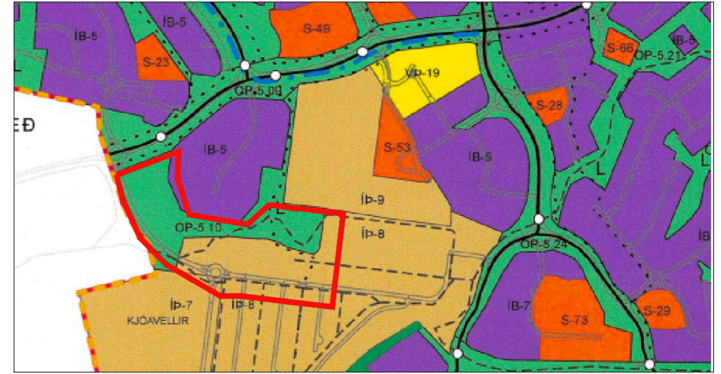
Skýringarmynd: Hluti aðalskipulags Kópavogs 2019-2040. Samþykkt í Bæjarstjórn 28. september 2021 Staðfest 28. desember 2021 - birt í b-deild 30. desember 2021